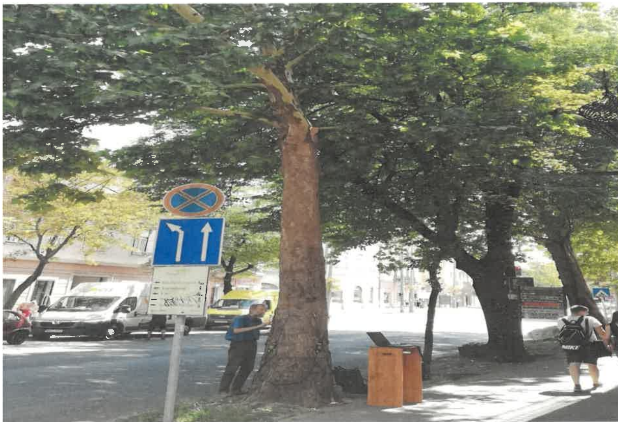
A fent látható képen éppen favizsgálat folyik...

2018. márciusában beszerzésre került egy Fakopp 3D elnevezésű nagyértékű favizsgáló készülék, melynek segítségével felmérhető a fák egészségi állapota, így egyértelműen megállapítható, hogy egy fa megérett-e a kivágásra, vagy sem.